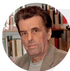
Jan Sokol český filozof, disident, překladatel filosofických textů, vysokoškolský pedagog, publicista a politik