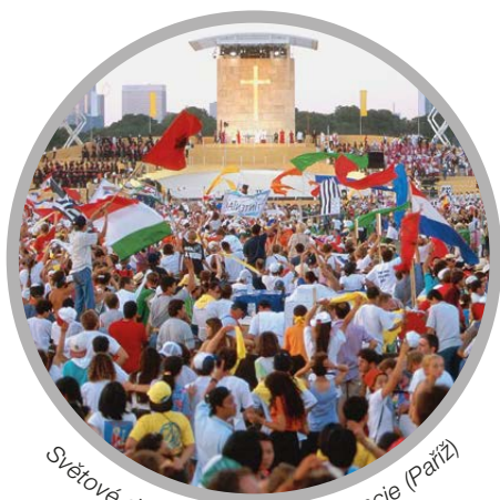
Světové dny mládeže 1997, Francie (Paříž)

Od svého prvního ročníku v Římě v roce 1986 se Světový den mládeže osvědčil jako „laboratoř“ víry, místo zrodu povolání k manželství a zasvěcenému životu, nástroj evangelizace a proměny církve.