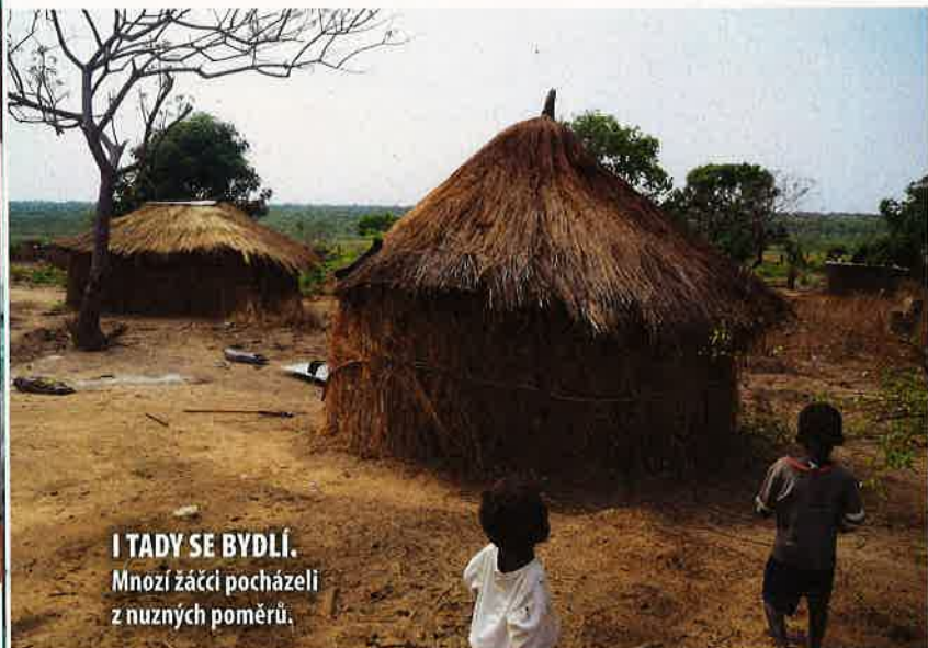
I TADY SE BYDLÍ. Mnozí žáci pocházeli z nuzných poměrů.