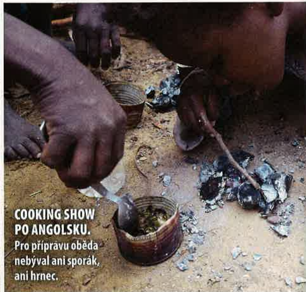
COOKING SHOW PO ANGOLSKU. Pro přípravu oběda nebyval ani sporák, ani hrnec.