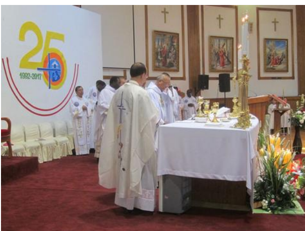
Oslavy 25. výročí...