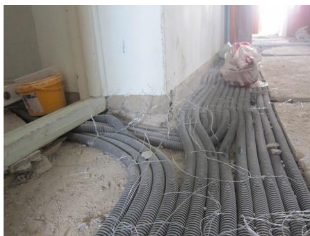
Generální rekonstrukce elektrorozvodů.