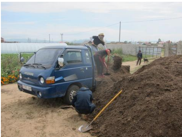
Práce na nedaleké farmě.