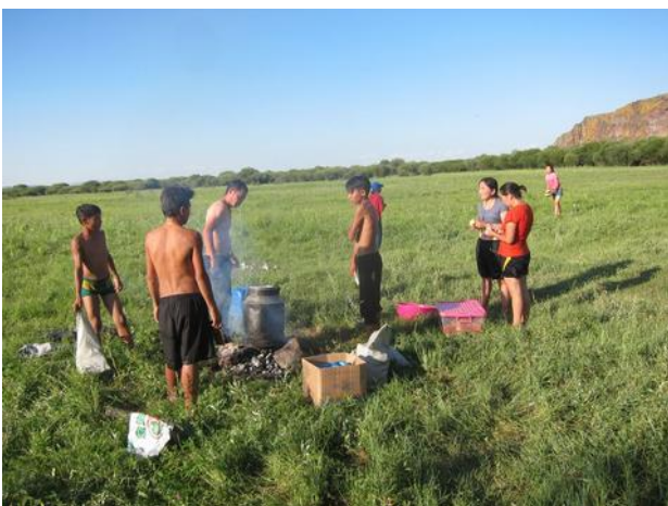
Odpolední výlet s mládeží.