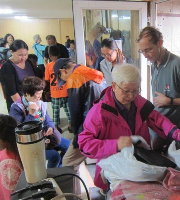
Návštěva z Hong-Kongu v oratoři.

nabídli také 10ti denní cyklo školu na čerstvě vybudovaném dopravním hřišti. „ Mohu se také připojit “, ptala se jedna maminka, které přivedla svou dceru. „ Proč ne, “ říkal jsem si v naději na získání nového spolupracovníka. Paní však na kole nikdy předtím neseděla. První den si při pádu z kola do krve odřela obličej. Ale ani další pády ji neodradily a po několika týdnech jsem ji spolu s její dcerkou potkal ráno na cestě k sestřám Matky Terezy s jízdním kolem. „ Díky moc za super lekce, o dopravních značkách a radě dalších věcí jsme nikdy před tím neslyšeli. “