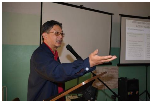
Teologický týden v Ulánbátaru.