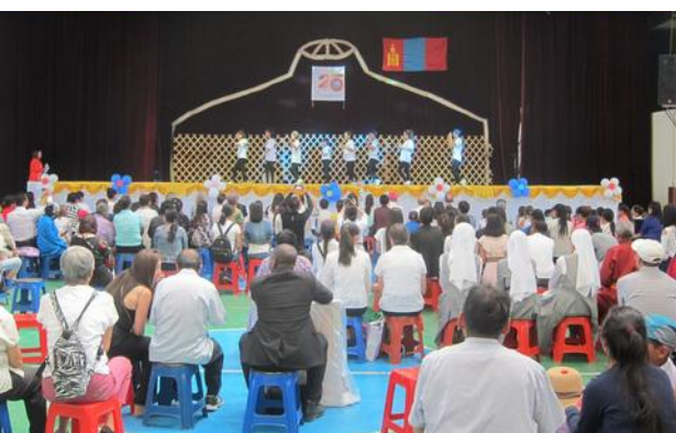
10. dopis z Mongolska – Oslavy 25 let CCM