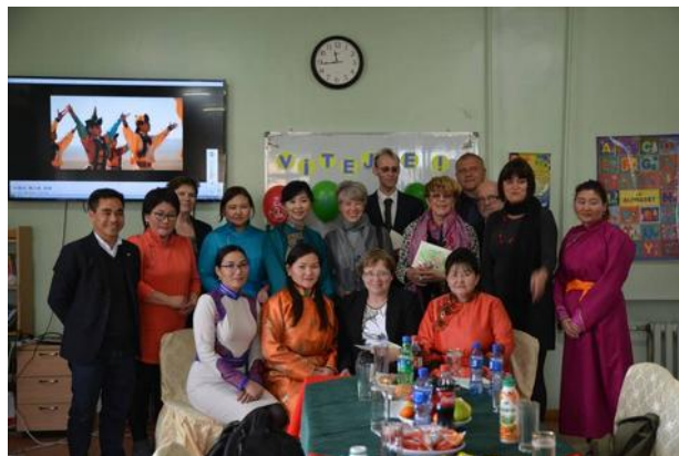
Parlamentní návštěva u salesiánů v Darkhanu.

V polovině května místní katolická církev při příležitosti 25. výročí své přítomnosti poprvé uspořádala misijně-teologický týden, kterého jsem se mohl také zúčastnit. Dva zahraniční lektori přednášeli současný pohled na misii po 2. vatikánském koncilu a dali nám také dostatek času na společnou reflexi.