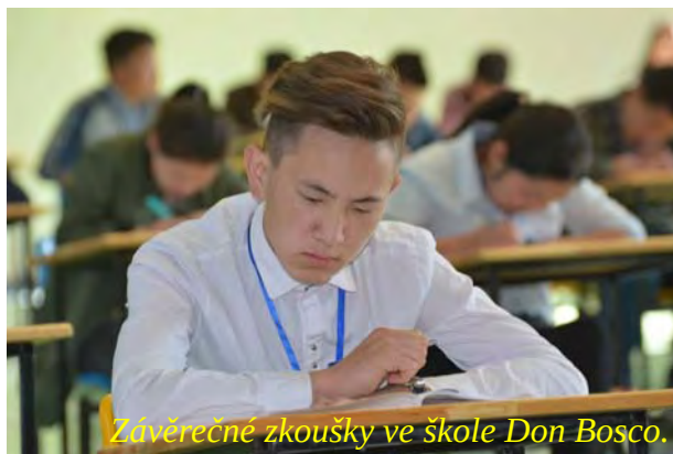
Závěrečné zkoušky ve škole Don Bosco.