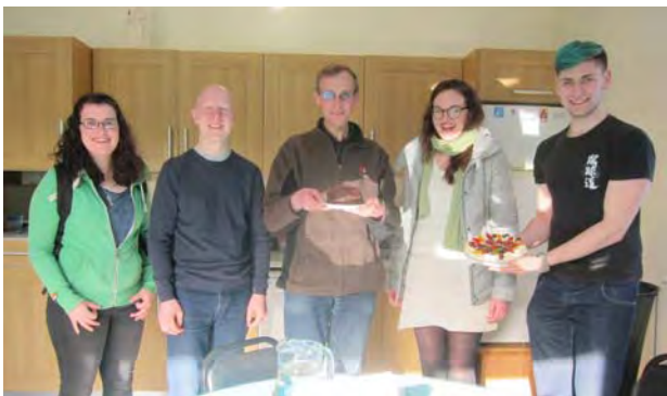
Rozloučení s "Youth 2000" v Maynoothu.