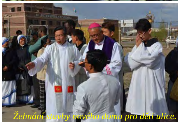
Žehnání stavby nového domu pro děti ulice.