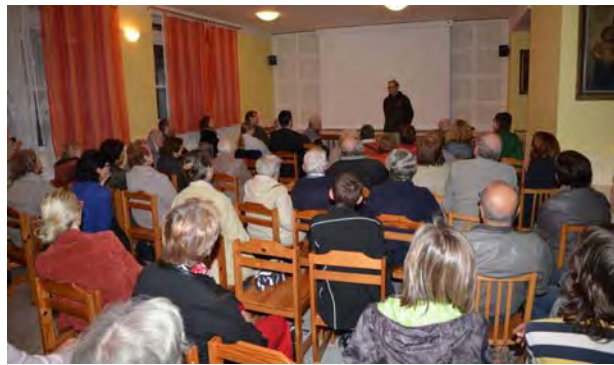
Beseda o Mongolsku v Kobylisích 18. 5. 2016

země vycházelo z toho, že spojující jazyk církve v Asii je angličtina. Je jednak denně používaná v salesiánských komunitách a pak je také výchozím jazykem pro studium dalších potřebných jazyků.