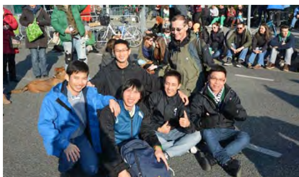
Salesiánští studenti angličtiny: mezi 5 Vietnamci je i jeden Čech.