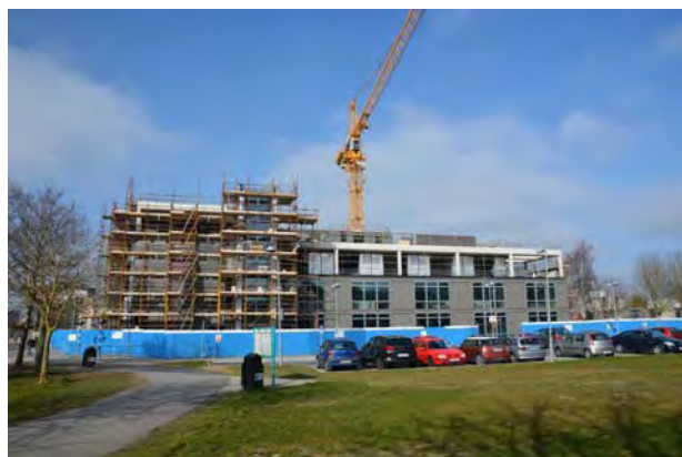
Maynooth: rozrůstající se univerzitní čtvrť, ve které se nachází náš salesiánský dům.