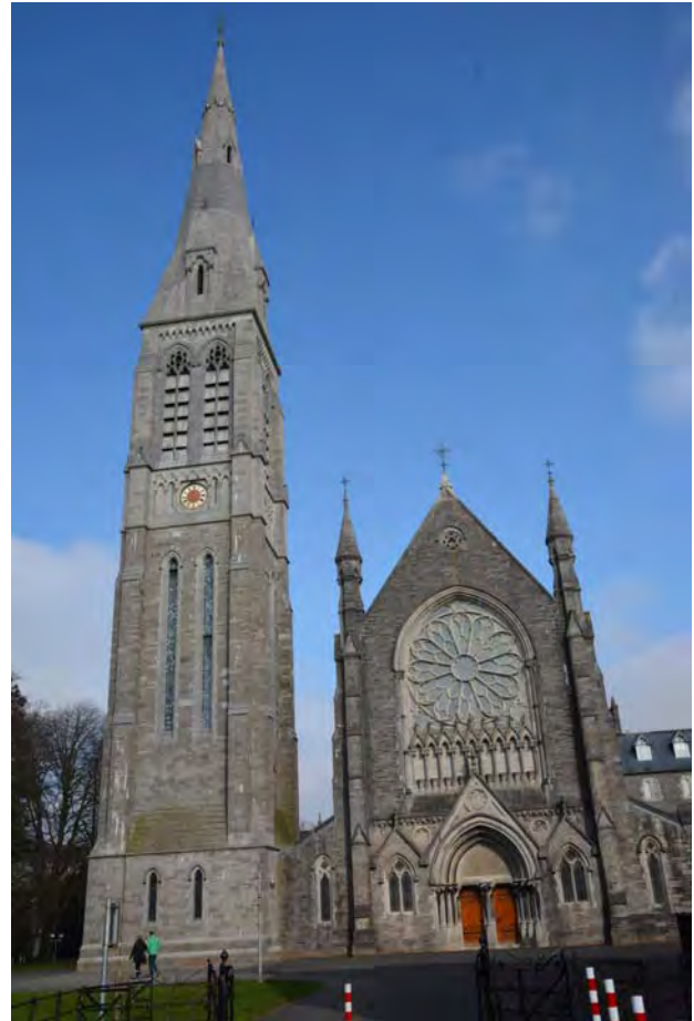
Seminární kaple v Maynoothu.