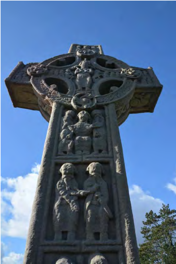
Irský kříž z Clonmacnoise.