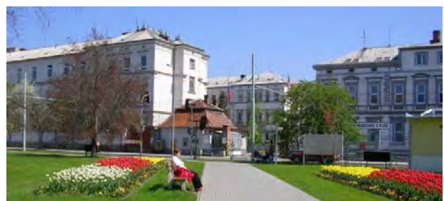
Nemocnice Plzeň Bory.